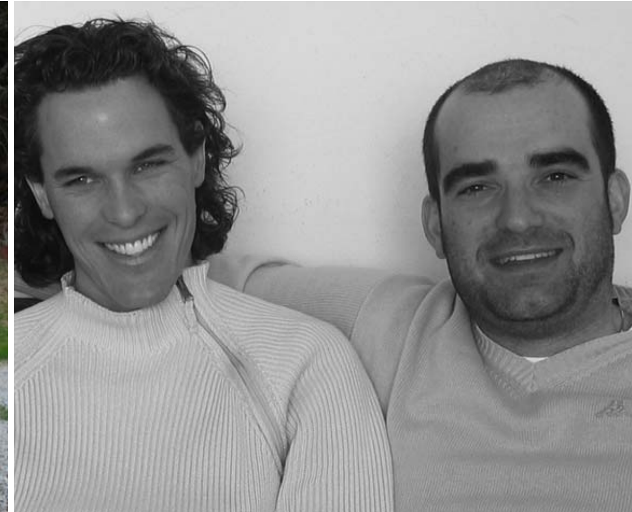
Das Wasserkraftwerk am Winnebach in Dörfel symbolisiert einen aus der Felswand herausgebrochenen Steinquader. Umlaufende Lichtbänder aus Glas unterstreichen die brüchige Materialität des Gesteins. Patrik Pedó und Juri Pobitzer lernten sich bereits während des Studiums kennen und gründeten zusammen das Architekturbüro Monovolume.