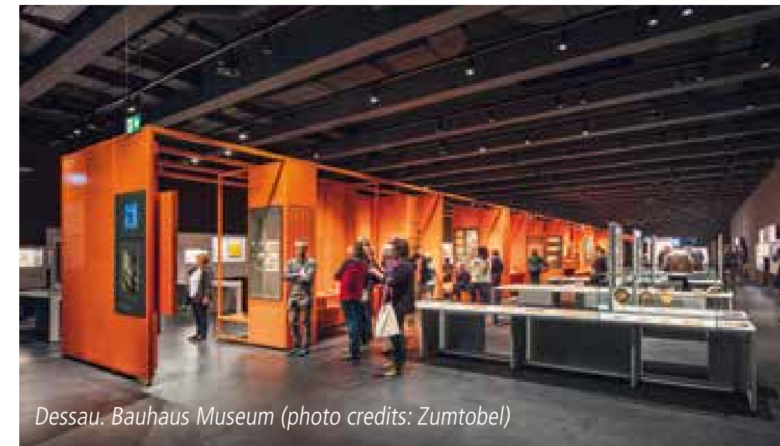
Dessau. Bauhaus Museum