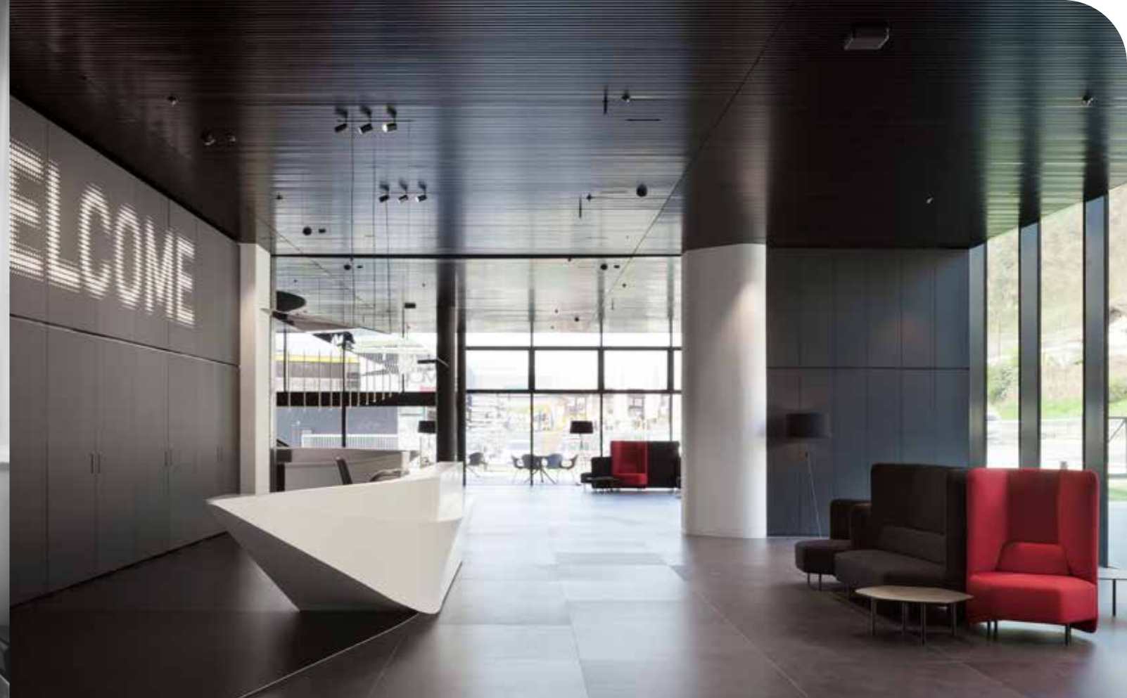
In der modernen Firmenzentrale von Durst Phototechnik AG Brixen (I) fügt sich unser picco bestens in das moderne und innovative Ambiente ein. In the modern company headquarters of Durst Phototechnik AG Brixen (I), our picco fits perfectly into. Nella moderna sede aziendale della Durst Phototechnik AG Brixen (I), il nostro picco.

Architektur und Produktdesign haben mehr Parallelen als man vermutet. Bevor es den speziellen Bereich des Produktdesigns gab waren es meist die Architekten die diese