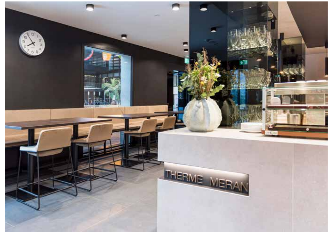
Im Bistro der Therme Meran in Südtirol setzt sich nun unser tonic metal Barhocker in Szene. Our tonic metal bar stool now sets the scene in the bistro of Terme Merano in South Tyrol. Il nostro sgabello tonic metal in scena al bistrot delle Terme Merano in Alto Adige.