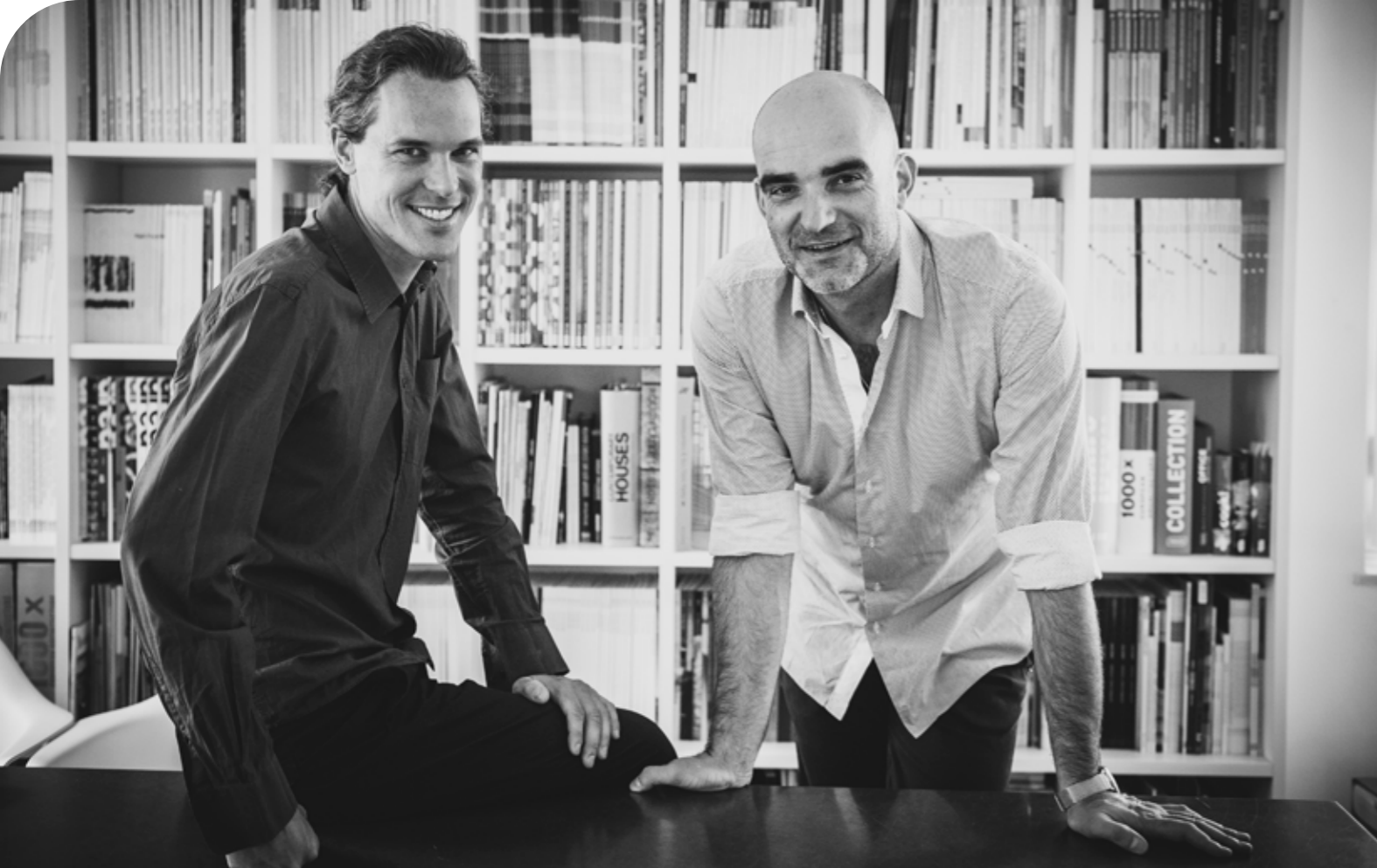
monovolume architecture + design Arch. Patrik Pedó & Arch. Jury Anton Pobitzer