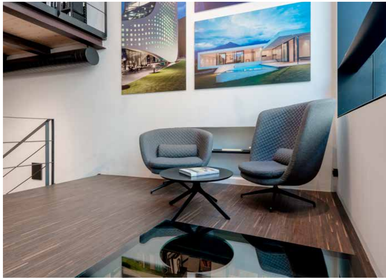
monovolume architecture + design headquarters Bolzano (I).